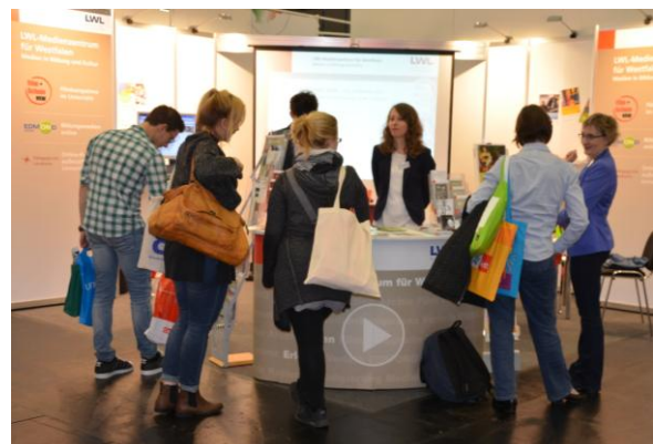
Das Team des LWL-Medienzentrums überzeugte mit einem vielfältigen Angebot und kompetenter Beratung.

Am gemeinsamen Messestand des LWL-Medienzentrums für Westfalen und von FILM+SCHULE NRW konnten Interessierte sich über die neuesten Filmproduktionen des Medienzentrums informieren und sich die Online-Bildungsportale EDMOND NRW und Pädagogische Landkarte NRW vorstellen lassen. Außerdem gab es Infos zu den Angeboten des Bildarchivs für Westfalen zur Arbeit mit historischen Fotografien und passgenaue Beratung zu allen Fragen der Filmbildung in der Schule von FILM+SCHULE NRW.